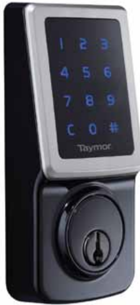
Concierge 400, courtesy / fournie par Taymor

Also new to the market are smartphone enabled locks. These are part of the “smart home” concept where appliances, lighting, heating, electronic devices, and now locks, can be controlled remotely by phone or computer. However, according to researchers it’s buyer-beware for these newest products. Security experts are pointing to subtle vulnerabilities that are just beginning to be understood. Until we know more, the non-smartphone enabled electronic locks, such as the Concierge 400, are a safe choice—providing security and convenience with tried and true technology.