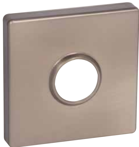
ROSETTE CARRÉE CONTEMPORAINE