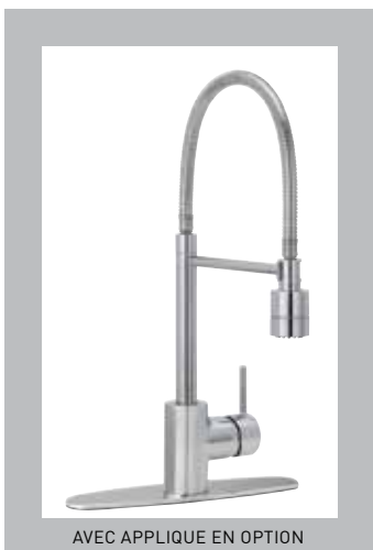
AVEC APPLIQUE EN OPTION