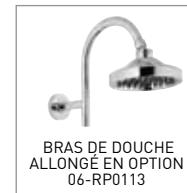
BRAS DE DOUCHE ALLONGÉ EN OPTION 06-RP0113