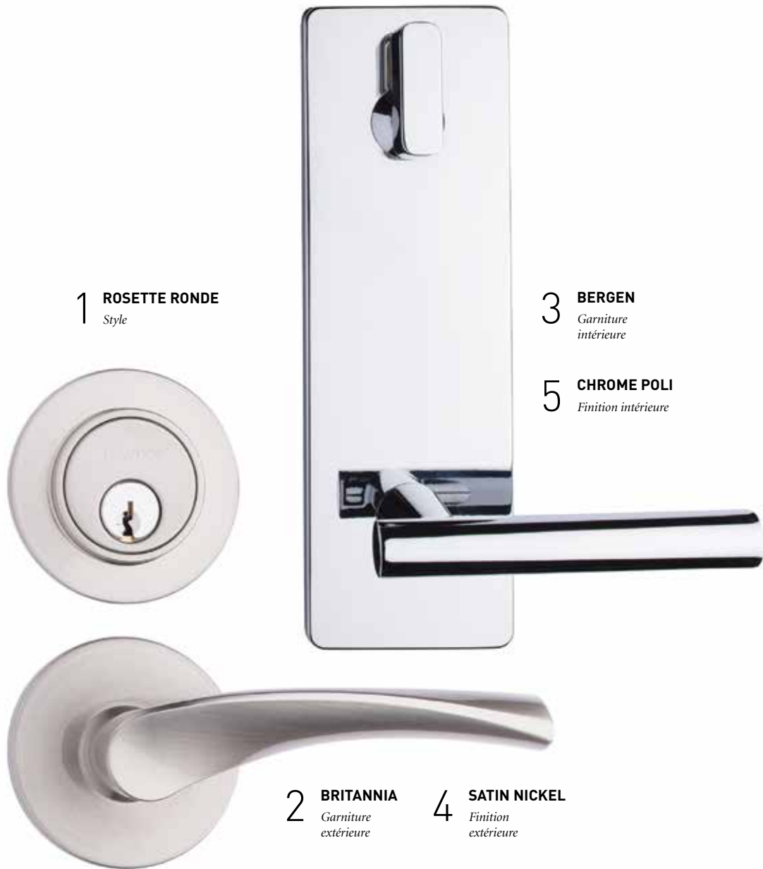
1 ROSETTE RONDE Style