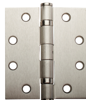
CHARNIÈRE SIMPLE À ROULEMENT À BILLES À BROCHE NON AMOVIBLE