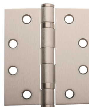
CHARNIÈRE SIMPLE À ROULEMENT À BILLES