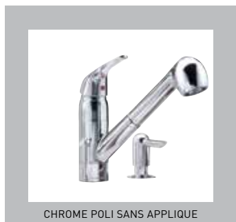
CHROME POLI SANS APPLIQUE