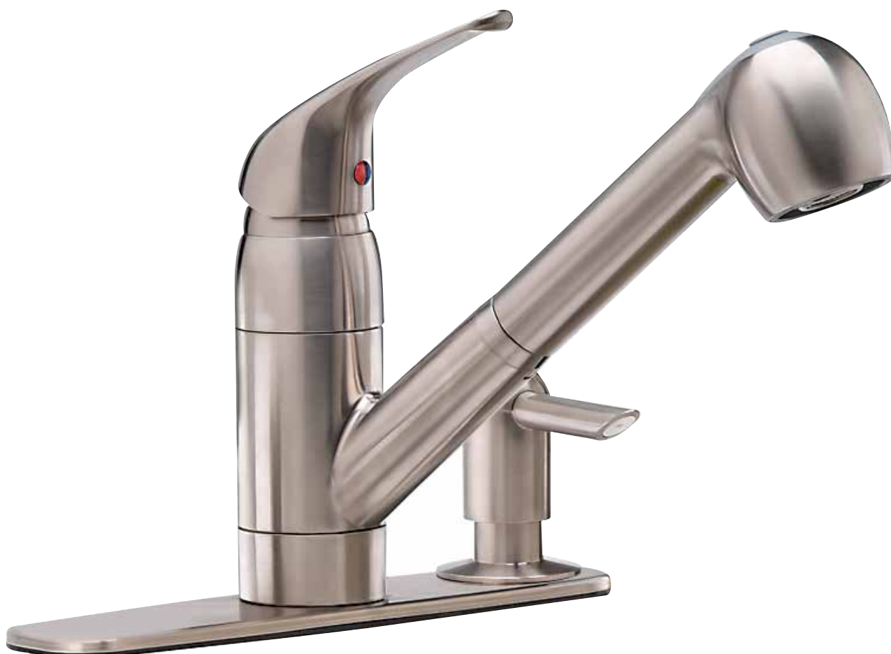
NICKEL SATINÉ PVD